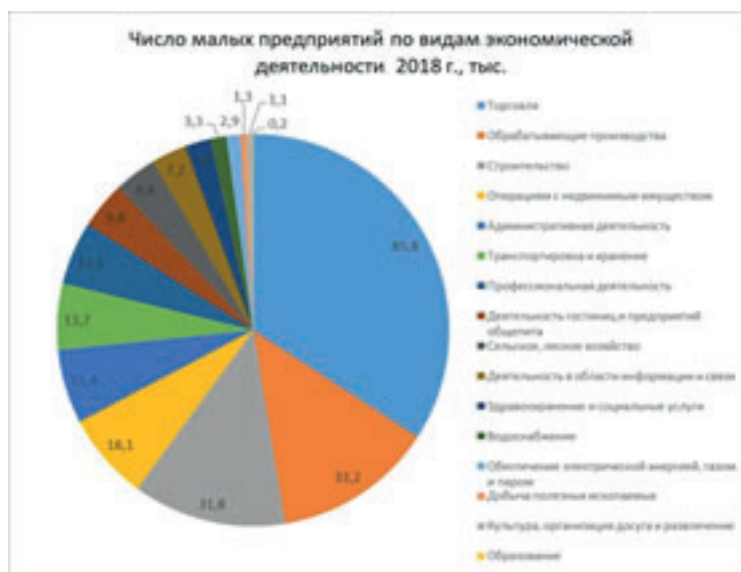
Рис. 3 – Результаты деятельности малых и средних предприятий России в 2018 году по видам и секторам экономической деятельности